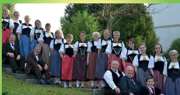
Trachtengruppe Grosshöchstetten 20. Juni 2026 | 16:00 - 16:20 / 16:40 - 17:00 Uhr