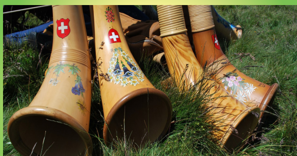
Alphornfreunde Chrummholz Grosshöchstetten 19. Juni 2026 | 16.45 Uhr 20. Juni 2026 | 15.00 21. Juni 2026 | 13.30 Uhr