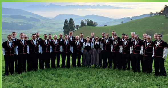
Jodlerklub Grosshöchstetten 21. Juni 2026 | 11:00 - 12:00 Uhr